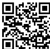
団体用申込フォーム